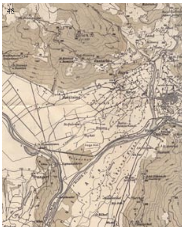
48. L'estensione territoriale del Comune di Gries nel 1887.

Il comune rurale di Gries nel 1828 1 risulta composto da sette quartieri. Essi sono elencati secondo il seguente ordine e così denominati: