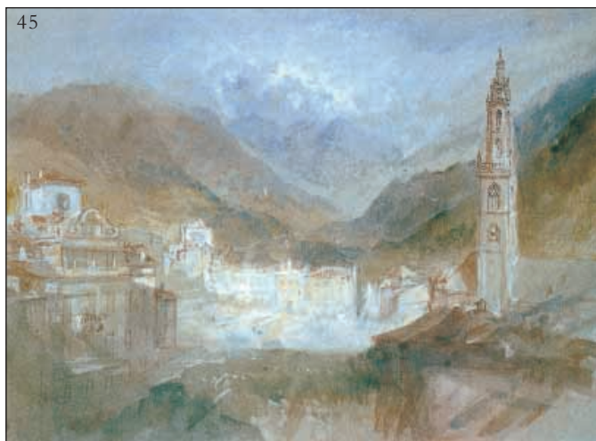
43. La Parrocchiale di Bolzano, in una stampa dell'Ottocento.