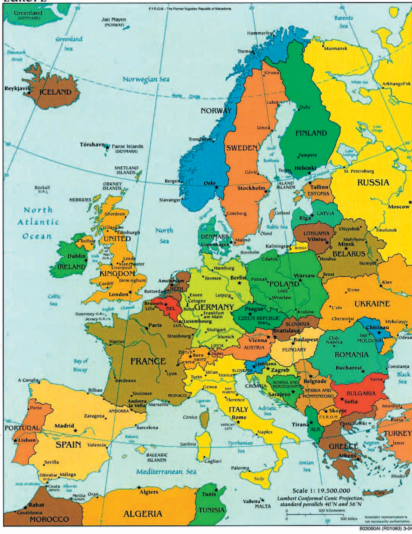
Europa nel 2007.