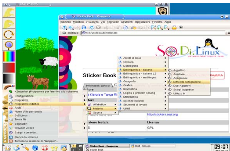
Fig. 3 – L'accesso ai software didattici può avvenire sia dalla banca dati che dal menù dei programmi didattici

Inoltre è possibile (in futuro) aggiornare il supporto all'hardware a patto di avere le conoscenze tecniche necessarie per farlo.